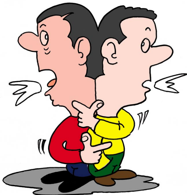
Dialogue de sourds

Le 30 novembre devait avoir lieu la première véritable réunion de travail consacrée à la fusion DGI-DGCP entre le ministère et les fédérations syndicales. La découverte du dossier préparatoire, essentiellement constitué de fiches descriptives des activités respectives des deux réseaux et ne comprenant pas la moindre analyse critique, inclinait à penser qu'il serait très difficile de rentrer dans le vif du sujet ; ce fut bien le cas !