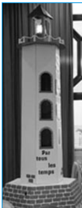
Le phare dans la salle de restaurant