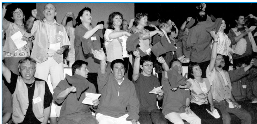
Une petite partie des organisateurs, au soir du 16 juin 2005.

L'administratrice des Pays de Loire avait de solides raisons d'être fière de la haute tenue du premier congrès tenu sur ses terres : le vingt cinquième !