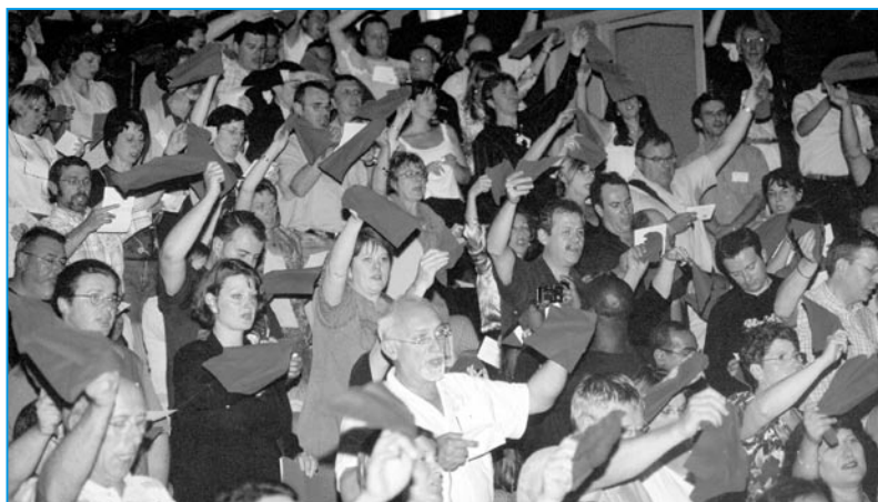
«Le chiffon rouge» lors de la clôture du Congrès