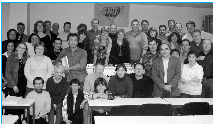
De toutes les régions, de tous les services, de tous les grades.

Face à cette «machine» qu'est devenue l'administration, plusieurs élus ont dénoncé l'attitude méprisante à leur égard de certains présidents de séance, ils ont aussi évoqué leurs difficultés avec leur direction. Liens forts avec l'ensemble du réseau SNUI, interlocuteurs directs des agents qui les sollicitent, ils ont le sentiment qu'il devient de plus en plus difficile de «faire de l'humain» et de satisfaire aux demandes qu'ils reçoivent, pour autant ils ont pris l'engagement de demeurer combatifs pour maintenir au plus niveau possible les garanties de gestion de tous les fonctionnaires de la DGI.