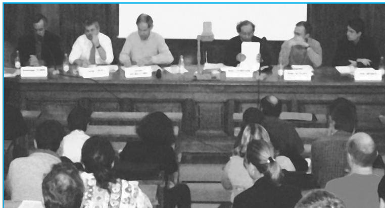
«La fiscalité et le SNUI à la Sorbonne»